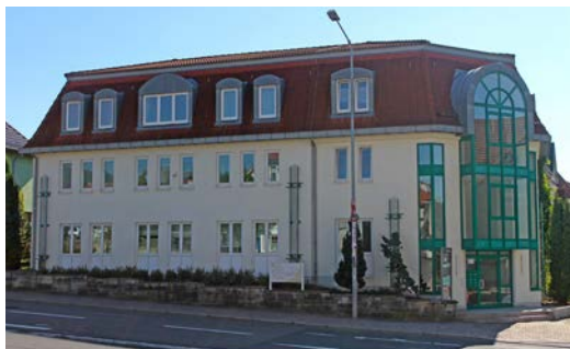
Puschkinstraße 1 • 98527 Suhl