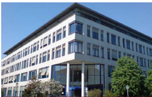
Löscherstraße 16 • 01309 Dresden