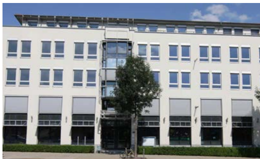
Heinrichstraße 92 • 99092 Erfurt