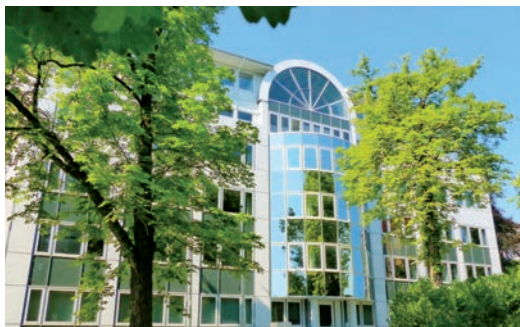
Parkstraße 28 • 09120 Chemnitz