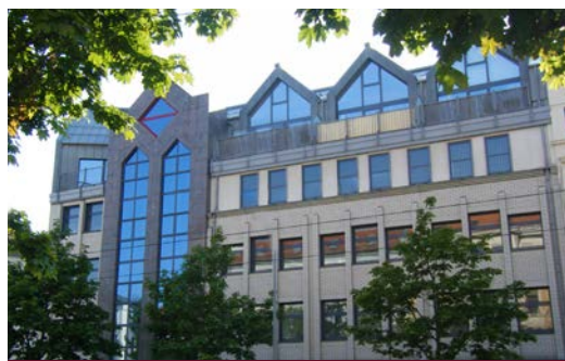
Landsberger Straße 23 • 04157 Leipzig