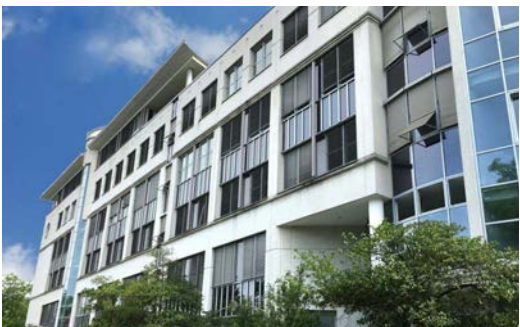
Trachenbergring 93-93a • 12249 Berlin