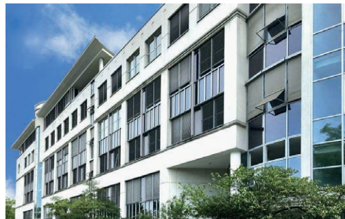
Trachenbergring 93-93a • 12249 Berlin