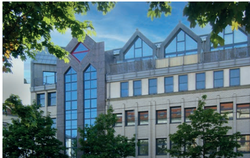
Landsberger Str. 23 • 04157 Leipzig