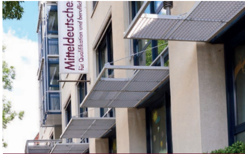
Heinrichstraße 89 • 99092 Erfurt