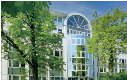
Parkstraße 28 • 09120 Chemnitz