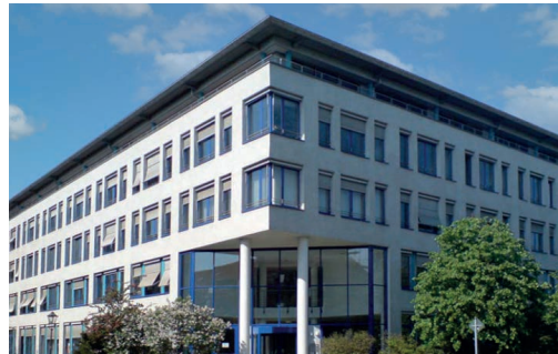
Löscherstraße 16 • 01309 Dresden