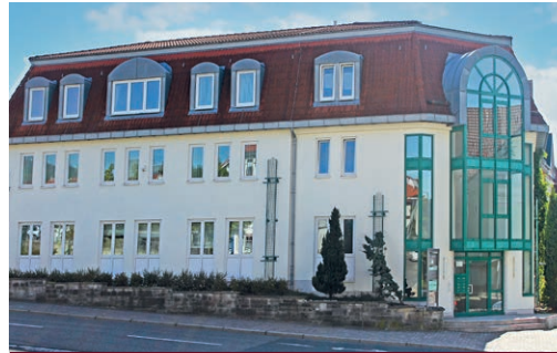
Puschkinstraße 1 • 98527 Suhl